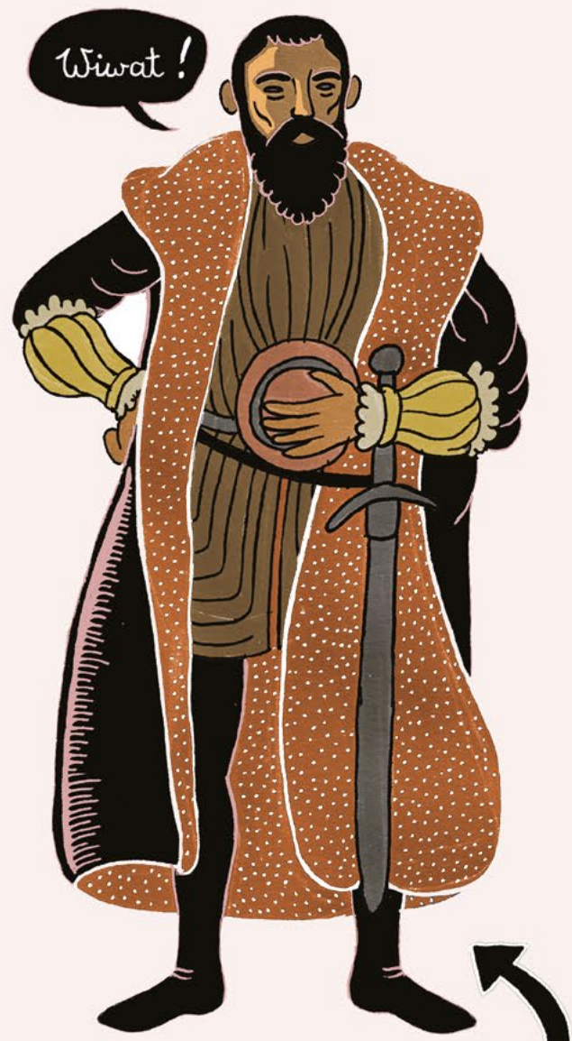
Zygmunt II August, pierwszy władca Rzeczypospolitej Obojga Narodów

Zobacz więcej pod hasłem: 4. Wolna elekcja | 5. Sejm walny