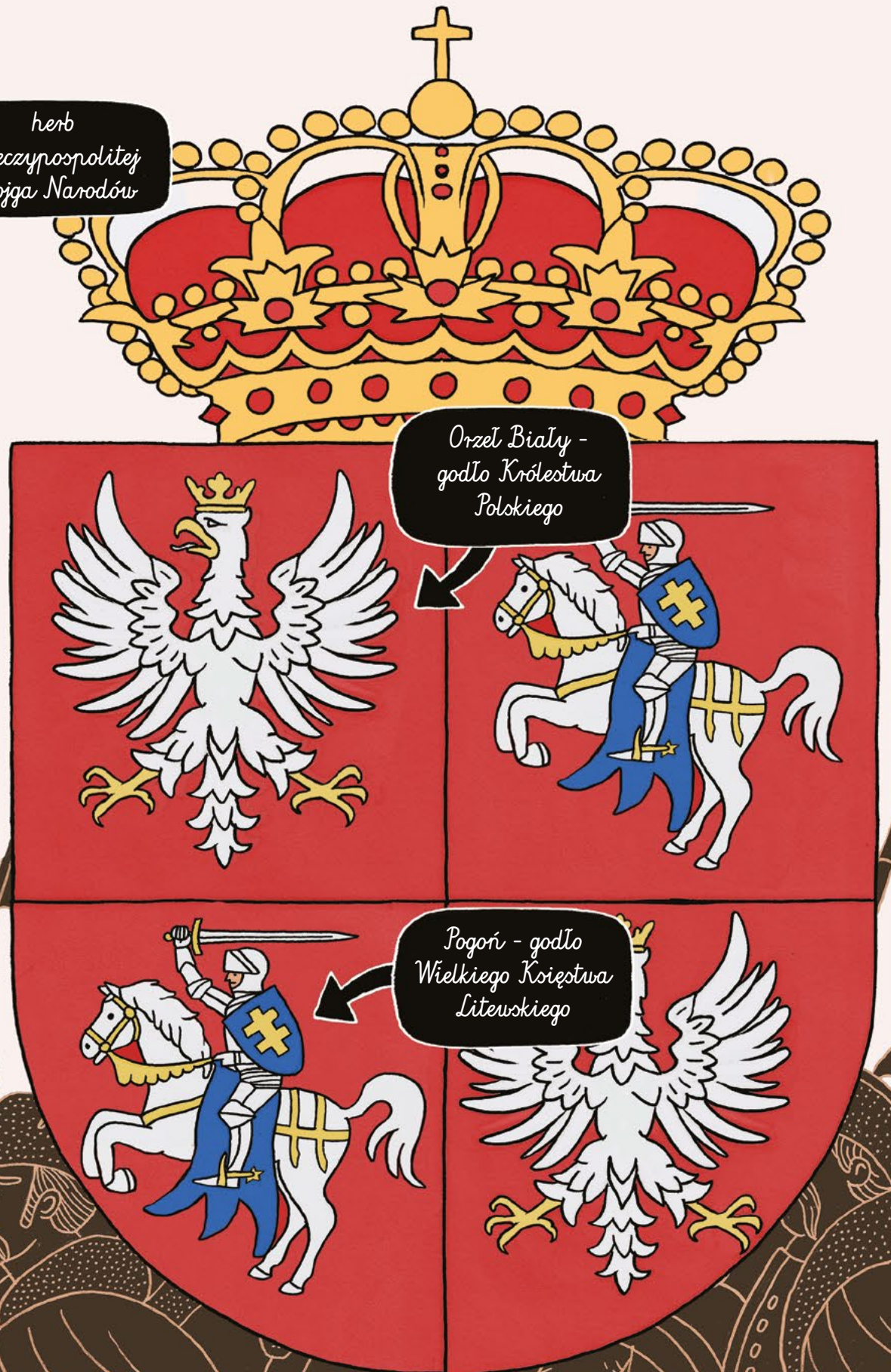
Orzeł Biały - godło Królestwa Polskiego