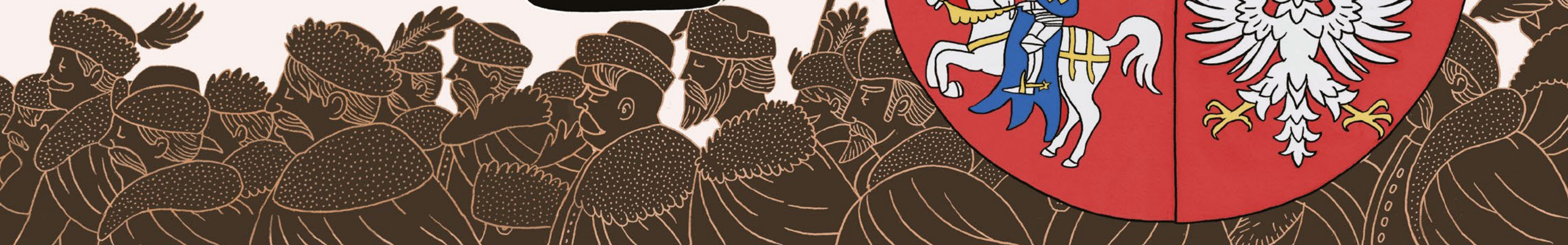
Pogoń - godło Wielkiego Księstwa Litewskiego